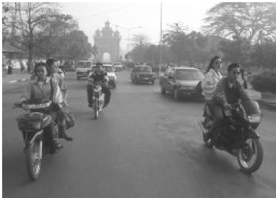
ຜູ້ໃດກໍ່ຢາກໄປເຮັດວຽກຢູ່ ເມືອງໃຫຍ່

ຂ່າວນີ້ແມ່ນຂ່າວກ່ຽວກັບລະເບີດແຕກແລະມີຄົນໄດ້ ຮັບບາດເຈັບ ແຕ່ວ່າກວ່າຈະເຂົ້າເລື່ອງ ກໍ່ມີການສະແດງ ຄວາມຄິດເຫັນກ່ຽວກັບເມືອງດ້ວຍຫຍໍ້ໜ້າທີ່ຍືດຍາວ.