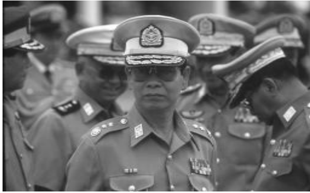
ເອົາລາຍຊື່ພະນັກງານ ອາວຸໂສໃສ່ຂ່າວຕາມຫລັງ

ຫຍັງໃສ່ວັກນຳ. ຢ່າເອົາ ຫລາຍຄວາມຄິດ, ລາຍ ລະອຽດທີ່ບໍ່ສຳຄັນປານ ໃດ ແລະ ສາມາດເວົ້າ ຕາມພາຍຫລັງໄດ້ໃສ່ ໃນວັກນຳ. ທ່ານບໍ່ຈຳ ເປັນຕ້ອງເອົາຄຳຕອບ 5W ແລະ H ມາໃສ່ໄວ້ ໃນວັກນຳບາດດຽວ.