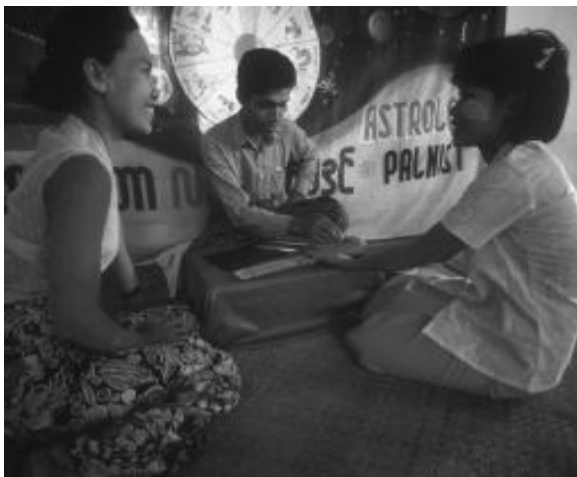
ການດູມໍ່ເປັນຂ່າວລັກສະນະສາລະຄະດີທີ່ດີໄດ້

ຫລັງຈາກວັກນຳແບບອ້ອມຄ້ອມກໍ່ແມ່ນຫຍັ້ໜ້າ ທີ່ບອກຫົວເລື່ອງຫລັກແກ່ຜູ້ອ່ານວ່າຂ່າວນີ້ກ່ຽວກັບຫຍັ້ງ. ຫຍັ້ໜ້ານີ້ຈະເຊື່ອມຕົວຢ່າງ, ພາບຫລືສາກເຂົ້າກັບຫົວເລື່ອງ ຊຶ່ງມັກຈະກຳນົດໄວ້ບໍ່ໃຫ້ກາຍຫຍັ້ໜ້າທີ່ຫົກຫລືຫົດເຈັດ.