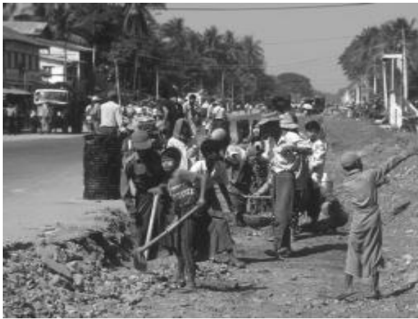
ເອົາເລື່ອງລາວຂອງແຮງງານ ເດັກຜູ້ໜຶ່ງໃນບັນດາເດັກນ້ອຍ ເຫລົ່ານີ້ມາຂຽນວັກນຳໄດ້

ວັກນຳແບບອ້ອມຄ້ອມ ເໝາະສົມສຳລັບ ຂ່າວລັກສະນະສາລະ ຄະດີ. ນັກຂຽນມັກເລີ່ມ ຕົ້ນດ້ວຍຕົວຢ່າງທີ່ໜ້າ ສົນໃຈ ອາດເປັນເລື່ອງ ລາວສັ້ນໆກ່ຽວກັບບຸກ ຄົນຫລືເຫດການ ເພື່ອ ໃຫ້ເຫັນພາບປະເດັນສຳ ຄັນຂອງຂ່າວ ຊຶ່ງເປັນ ການຊັກນຳຜູ້ອ່ານເຂົ້າສູ່ ເລື່ອງ.