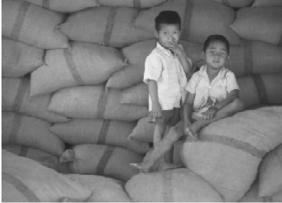
ເຂົາຈະພໍກິນບໍ່ ສໍາລັບຊາວບ້ານນີ້ ?

ໃດແດ່ທີ່ຈະຊ່ວຍເຂົາເຈົ້າບໍ່ໃຫ້ໄດ້ຮັບຜົນກະທົບຈາກໄພ ນໍ້າຖ້ວມໃນອະນາຄົດ ? ຫລືອົງການສະຫະປະຊາຊາດ ຊ່ວຍເຫລືອໄດ້ແຕ່ສະບຽງ ອາຫານທີ່ນັ້ນບໍ່ ?