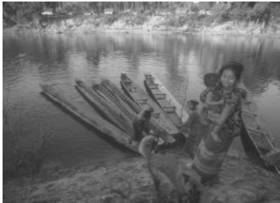
ອະທິບາຍໃຫ້ເຫັນວ່າ ຕົວເອກໃນເລື່ອງເຂົ້າກັບ ຂ່າວໄດ້ແນວໃດ?

ໃນການຂຽນຂ່າວພິທີຕ່າງໆ ນັກຂ່າວມັກເຮັດຜິດແບບ ດຽວກັນກັບການຂຽນຂ່າວຄຳປາໄສແລະກອງປະຊຸມຖະ ແຫລງຂ່າວ. ວັກນຳເນັ້ນໃສ່ຂ້າລັດຖະການອາວຸໂສທີ່ມາ ຮ່ວມແລະດຳເນີນພິທີ. ແຕ່ວ່າແມ່ນຫຍັງຄືຂ່າວທີ່ແທ້ຈິງ ?