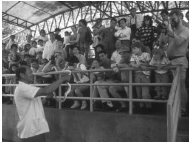
ຢ່າເບິ່ງແຕ່ຈຳນວນ ນັກທ່ອງທ່ຽວ

ຖຸນາ ປີ 2001 ເມື່ອສົມ ທຽບກັບໄລຍະເວລາ ດຽວກັນນີ້ຂອງປີອື່ນໆ ແລ້ວເປັນແນວໃດ ບໍ່ ພຽງສະເພາະແຕ່ປີ 2000 ທໍ່ນັ້ນ. ອັນນີ້ ແມ່ນຕົວເລກສູງສຸດ ເທົ່າທີ່ຮວບຮວມໄວ້ ບໍ່ ? ຫລືແມ່ນຕົວເລກ ຕໍ່າກວ່າໃນປີ 1996 ກ່ອນເລີ່ມເກີດວິກິດ ດ້ານເສດຖະກິດຢູ່ໃນ